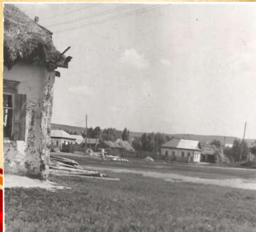
С. Кабановка, улица Почтовая. 1960 год