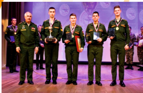
Победители олимпиады по английскому языку