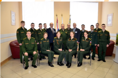
Победители олимпиады по химии