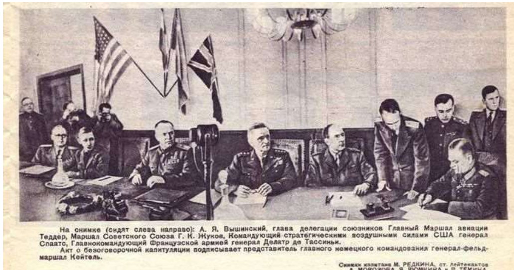
На снимке (сидят слева направо): А. Я. Вышинский, глава делегации союзников Главный Маршал авиации Теддер, Маршал Советского Союза Г. К. Жуков, Командующий стратегическими воздушными силами США генерал Спаатс, Главнокомандующий Французской армией генерал Делатр де Тассиньи. Акт о безоговорочной капитуляции подписывает представитель главного немецкого командования генерал-фельдмаршал Кейтель.