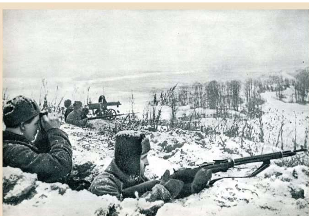
Оборона Москвы. Декабрь 1941 года.