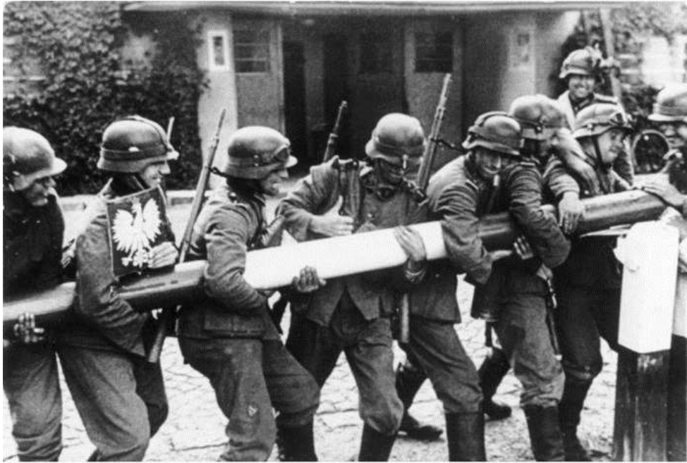
1. September 1939

1. Официальная дата начала Второй мировой войны связана с нападением на Польшу немецко-фашистских войск Германии 1 сентября 1939 года.