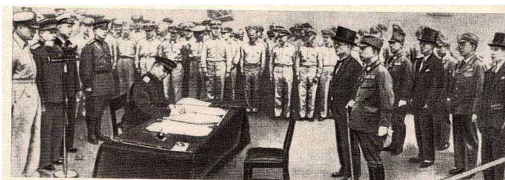
Подписание Акта о капитуляции Японии. От Советского Союза Акт подписывает генерал-лейтенант К. А. Деревянко. Сентябрь 1945 г.