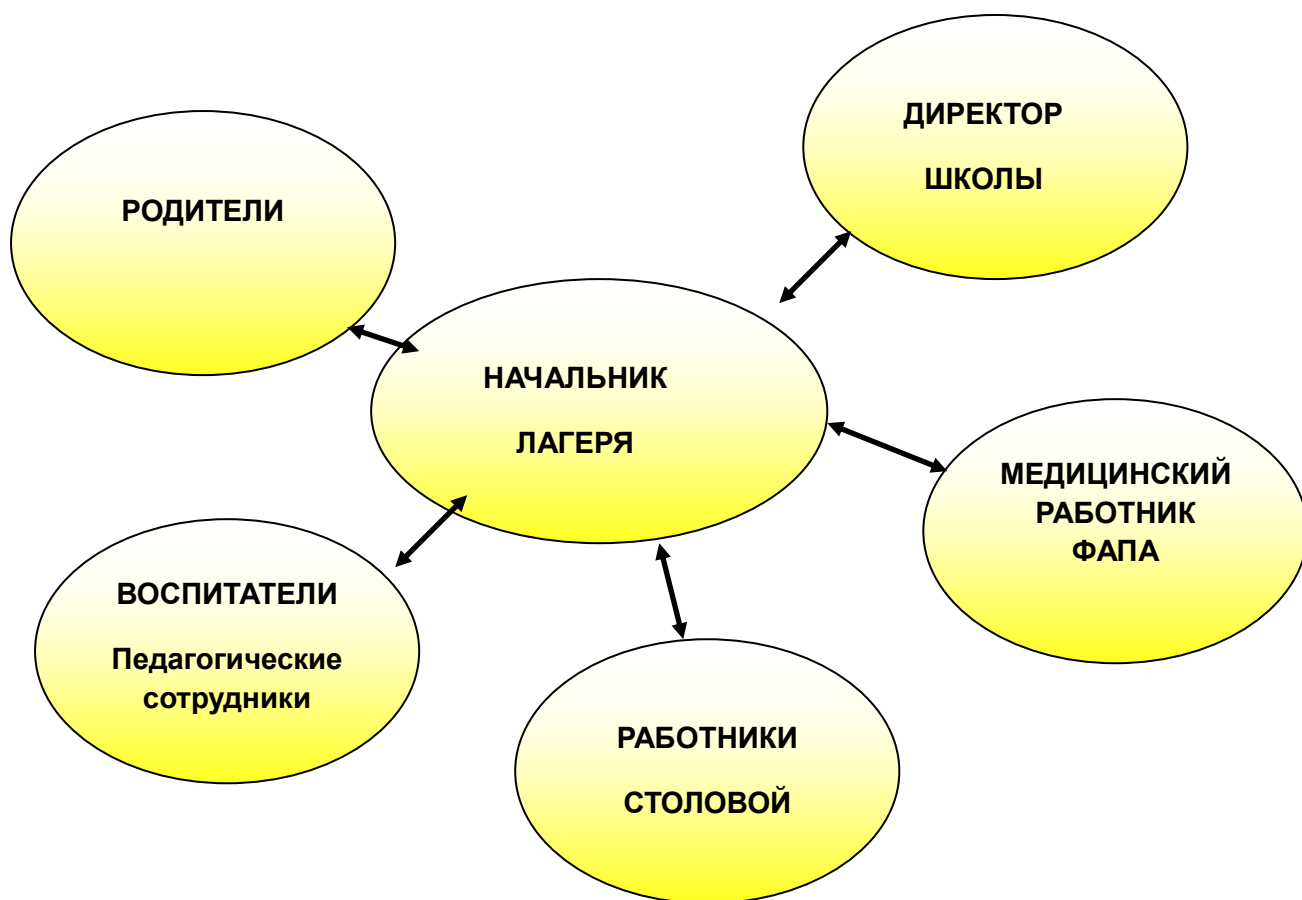
Схема управления воспитательным процессом в лагере с дневным пребыванием «Лукоморье»